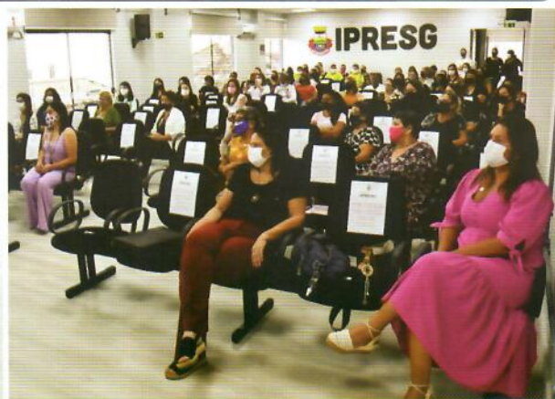
Evento do Dia Mulher - realizado pela Secretária Municipal de Assistência Social e Secretária da Saúde.